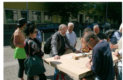
der Volksbildung angelegt.