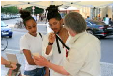
Gespräche, Gespräche, Gespräche: