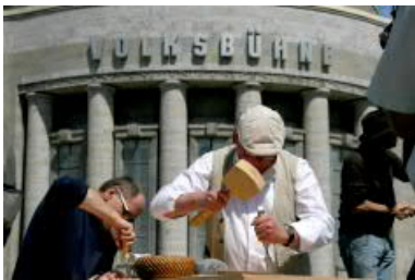
Teils trifft man ...