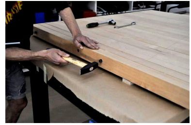
Zimmern der Stele.