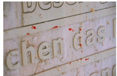
sich selbst (verräterische Blutspuren).