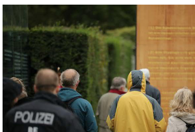
Besucher am Bundestag.