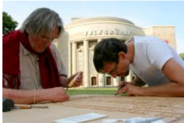
zur Eröffnung des 70sten Jahres des GG