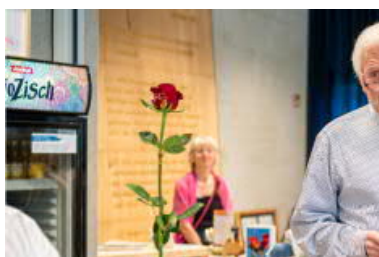
Die Stele in einer großen Kunstausstellung.