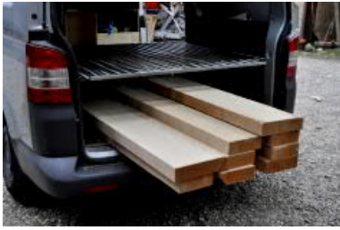
Besorgen des Holzes ...