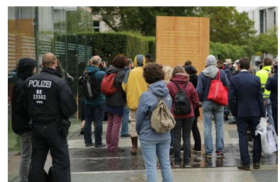
Permanente Volksbildung zum GG ...