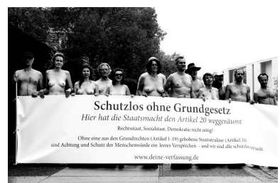
09.11.19: Protest nach ihrer Konfiszierung