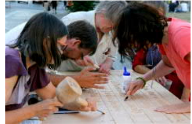
an der Volksbühne.