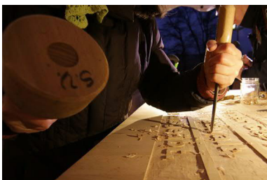
Schnitzen auch bei Nacht im Winter ...