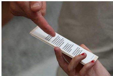
Das Ganze war und ist als Projekt ...