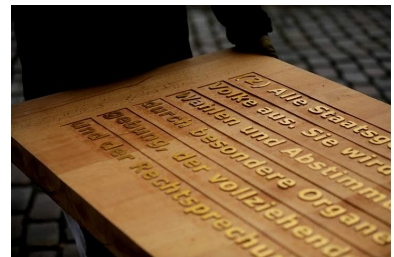
Schönheit pur ...