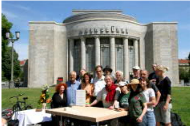
Beginn des Schnitzens – am 23.05.2018