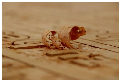
das Holz ... .. teils trifft man ...